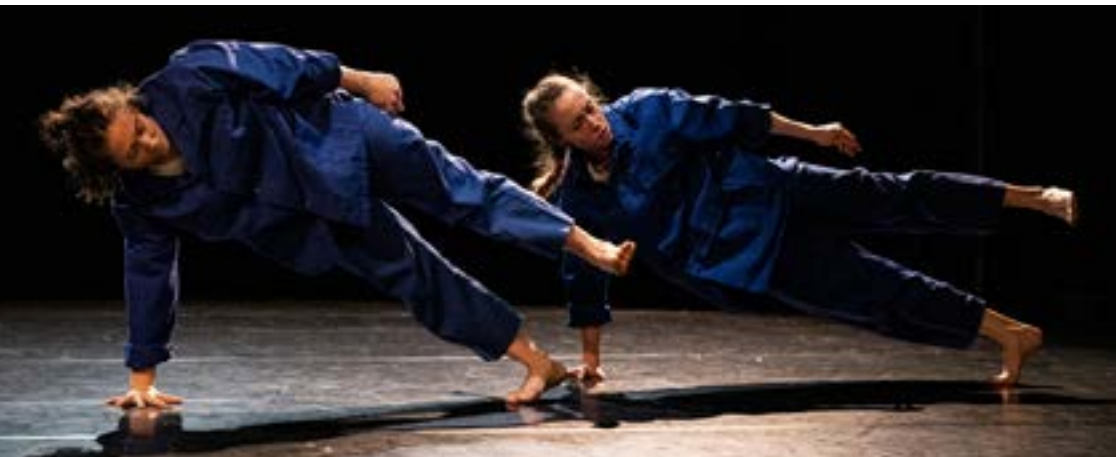
Festival Impulsion #10 Le Croiseur, Lyon 30 mars 2023