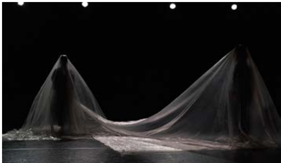
Festival Impulsion #10 Le Croiseur, Lyon 30 mars 2023