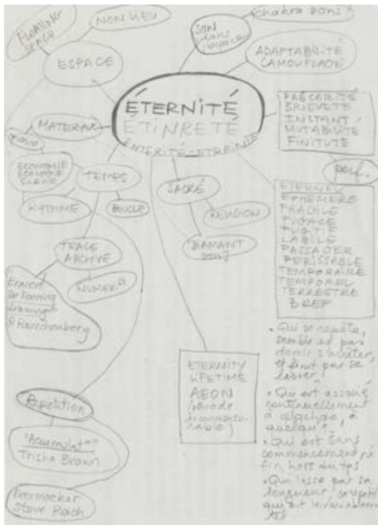
Mindmap, Emma Terno 2020